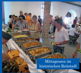
Mittagessen im historischen Reitstadl