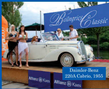
Daimler-Benz 220A Cabrio, 1955