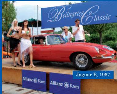
Jaguar E, 1967