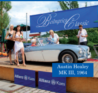
Austin Healey MK III, 1964