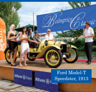
Ford Model-T Speedster, 1913