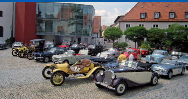
Mittags-Stop: Residenzplatz Neumarkt

Ca. 40% der Teilnehmer erhalten bei der Prämierung auf der Bühne in der Hauptstraße Geschenke und Preise.